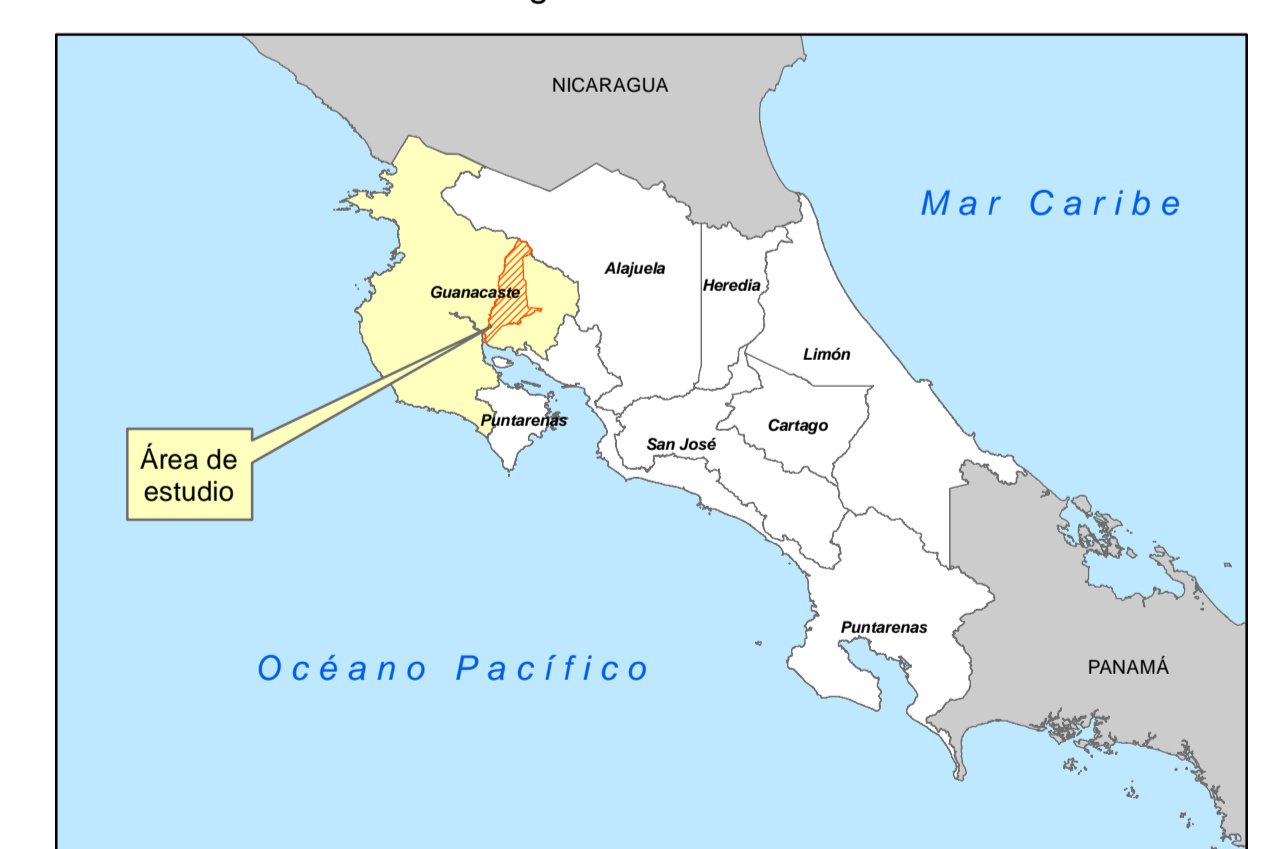
Diagrama de Ubicación