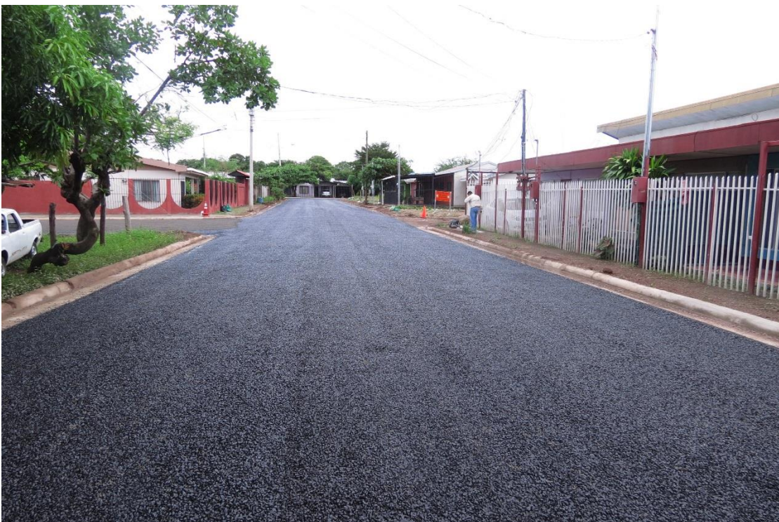
TSB3. 100 metros sur y 25 metros este de la Iglesia Católica. Barrio Unión.