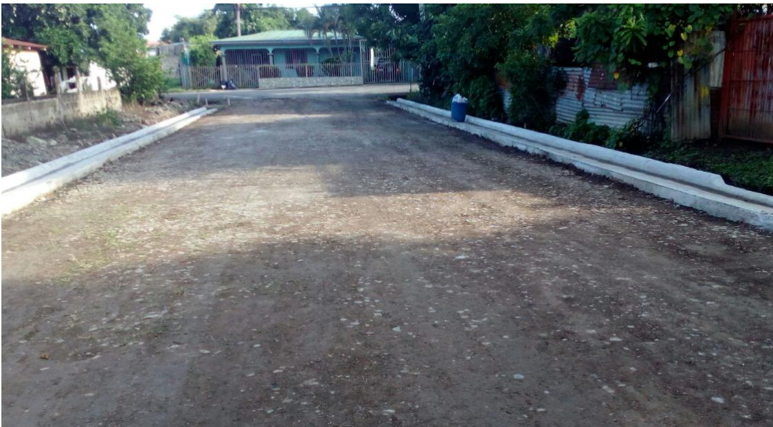
Construcción cordón y caño. Barrio Unión.