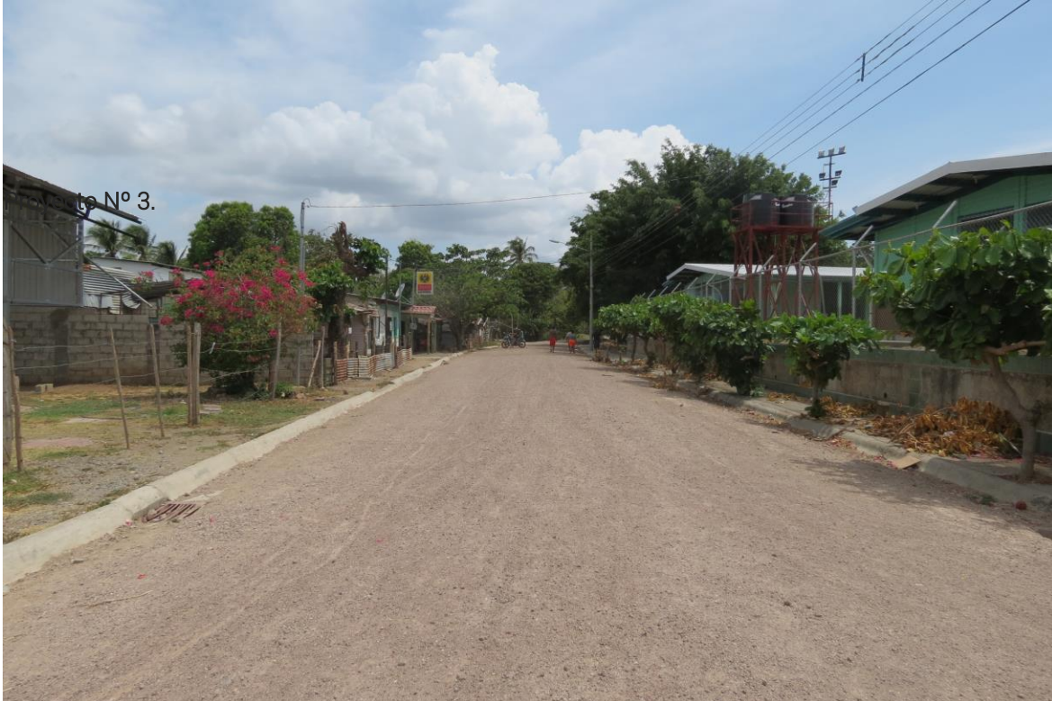
Mantenimiento caminos. Calles Bebedero. Distrito Bebedero