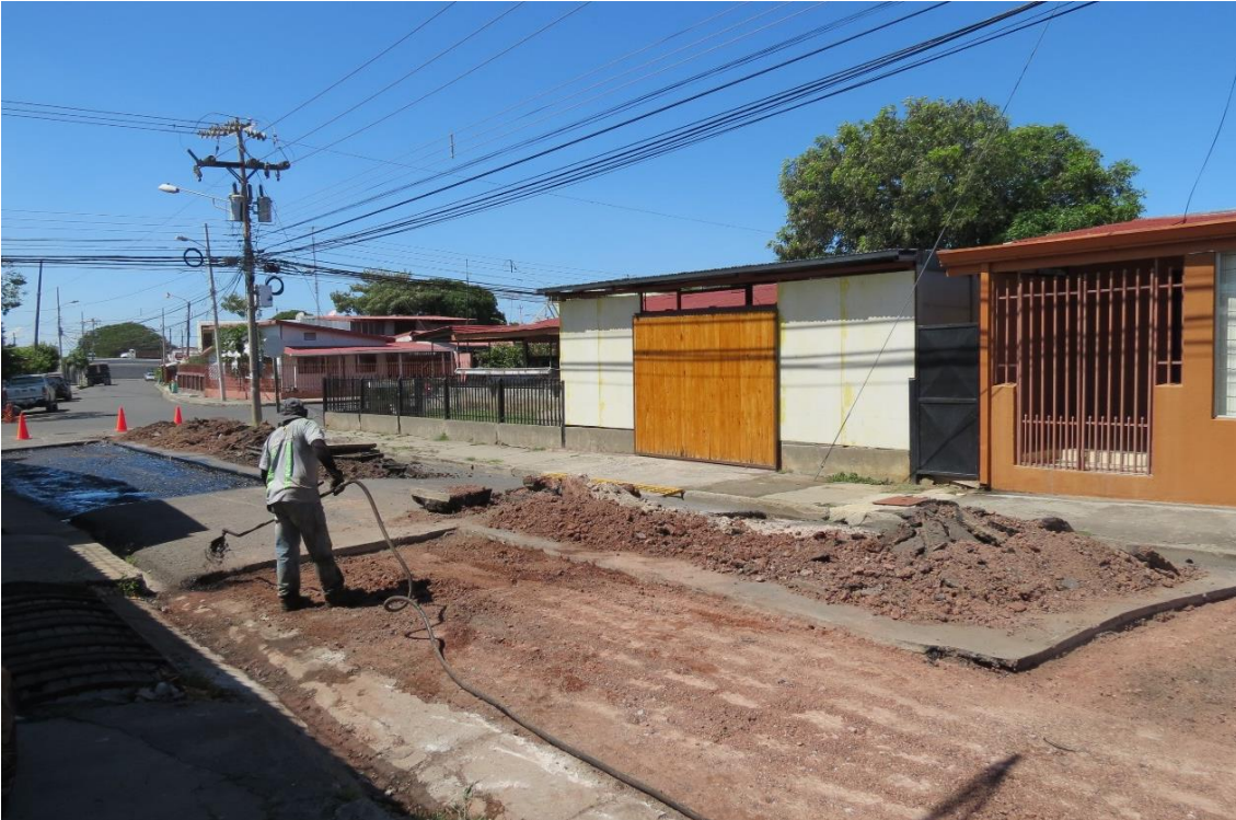
Bacheo de calles urbanas Cañas. Alrededores del Mercado Municipal.