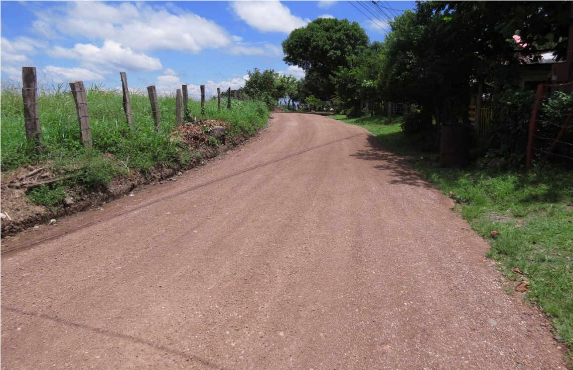
Mantenimiento caminos. Camino Higuerón – La Gotera. Distrito San Miguel

Mantenimiento periódico de 65,8 kilómetros de calles urbanas y caminos vecinales de Cañas