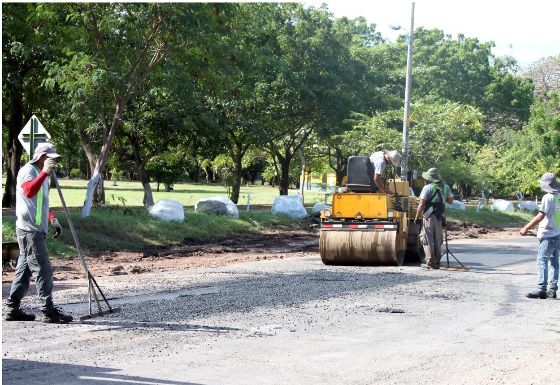
Bacheo de Calles Urbanas de Cañas. Alrededores del Polideportivo.