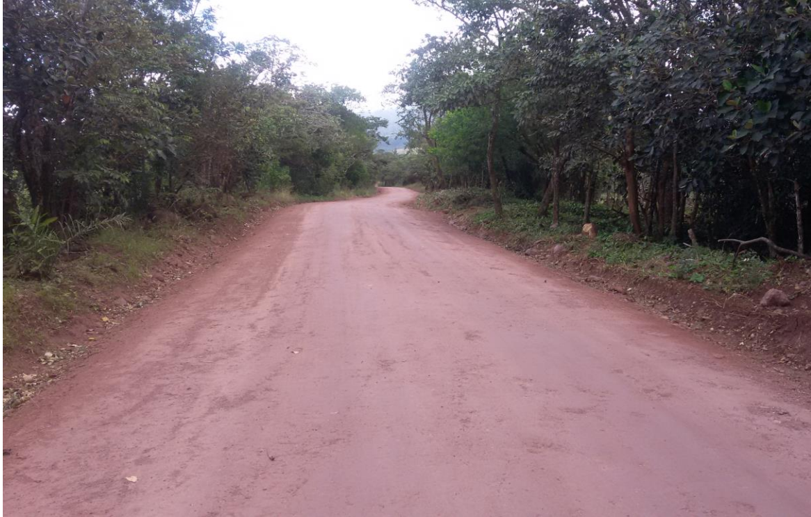
Mantenimiento caminos. Camino acceso Nueva Guatemala. Distrito Palmira