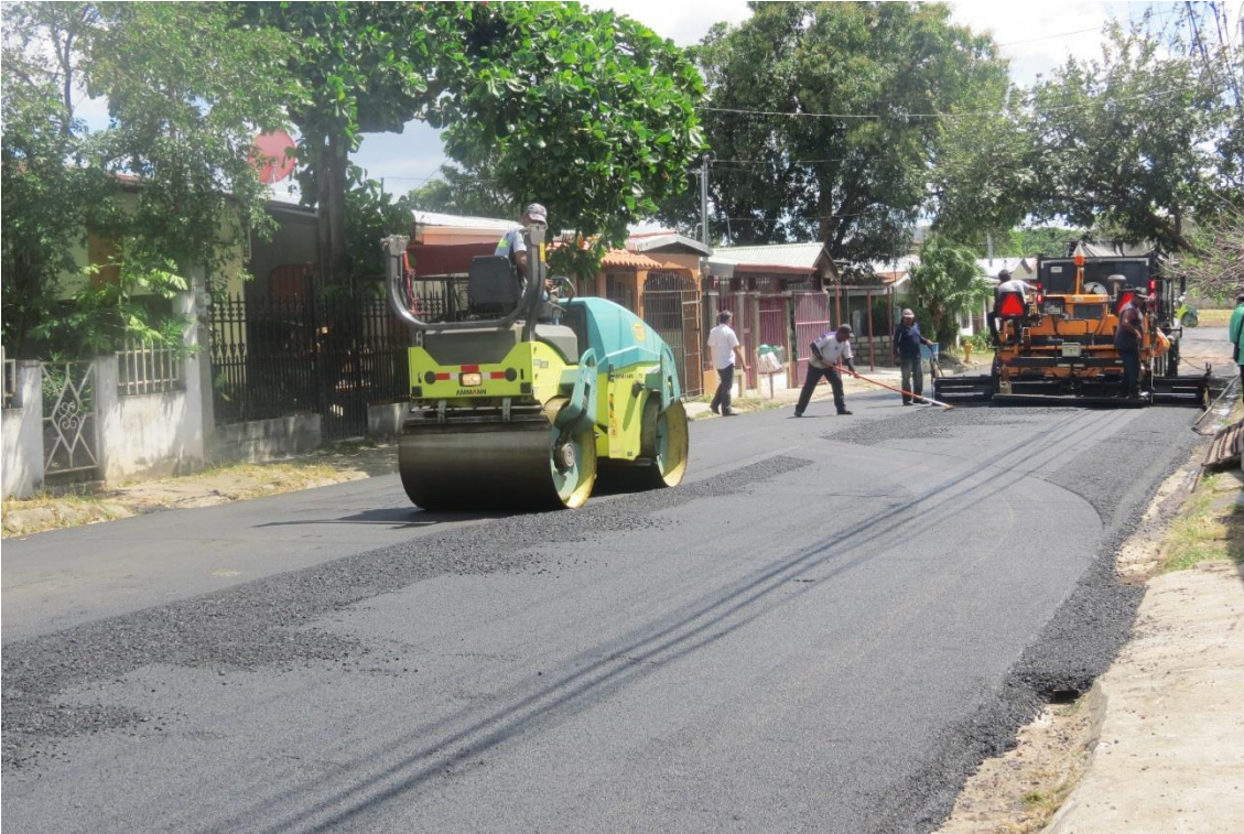
Colocación carpeta. Barrio Las Brisas.

Colocación de carpeta asfáltica en 1,9 km de calles urbanas de la ciudad de Cañas