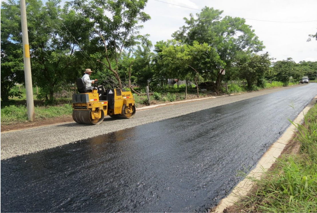
TSB3. Inmediaciones Ruta N° 1 – Verolís. Barrio Unión.

Colocación de tratamiento superficial bituminoso triple (TSB3) en 2,6 kilómetros de calles urbanas en la parte de la ciudad de Cañas