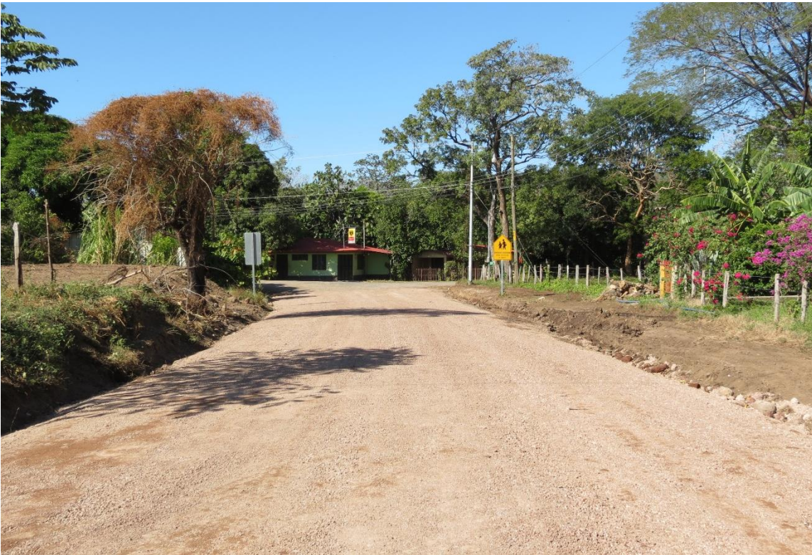
Mantenimiento caminos. Calles Sandillal. Distrito Cañas