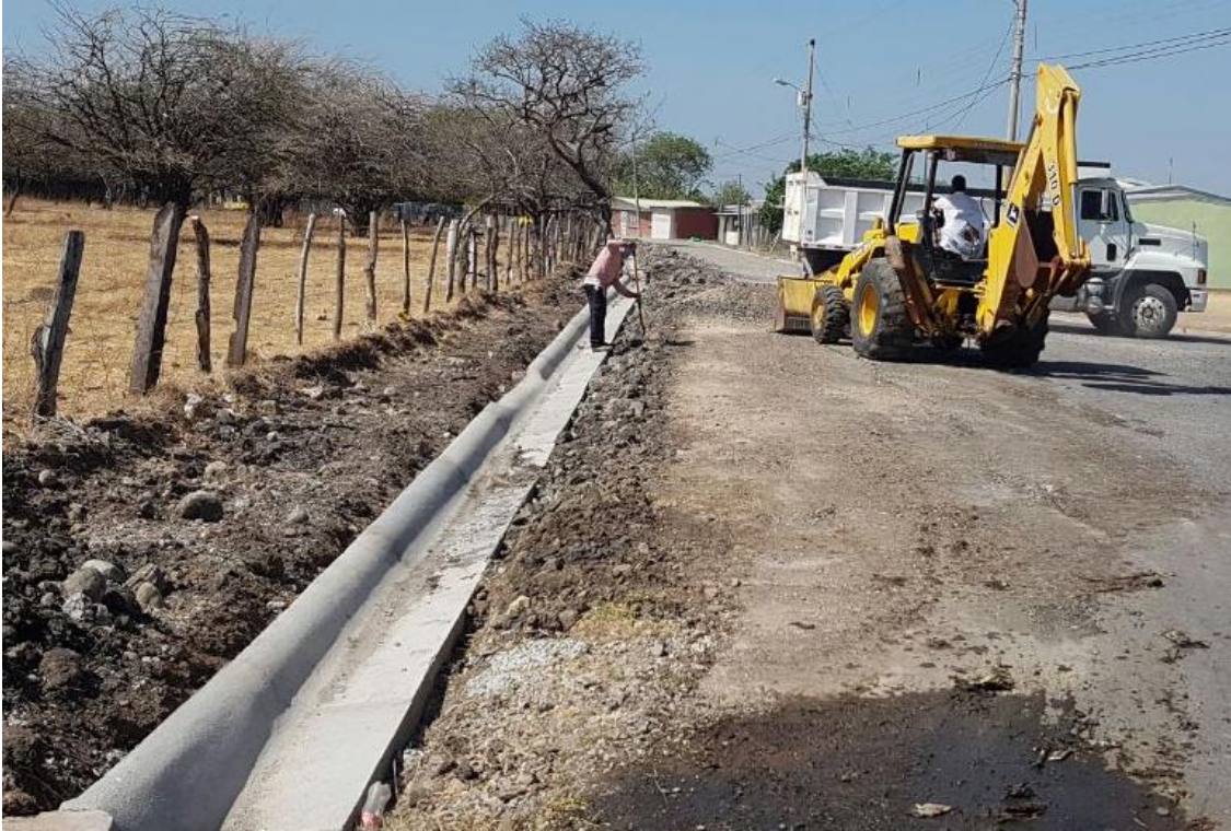
Construcción cordón y caño. Barrio Unión.

Construcción de 3 675 metros lineales de cunetas, cordón y caño en calles urbanas de la ciudad de Cañas