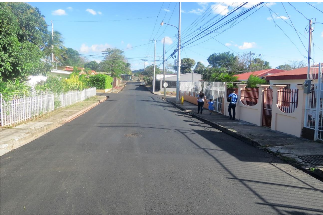
Colocación carpeta. Barrio San Cristóbal.