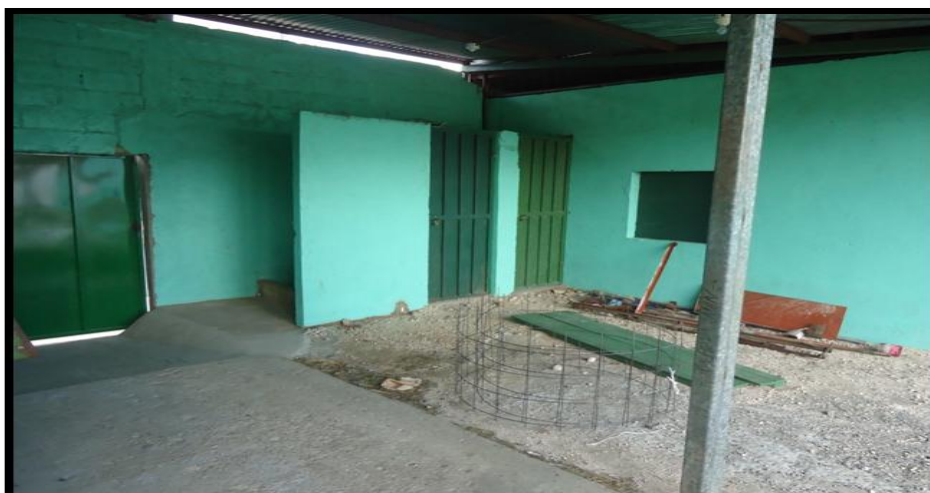
Se confeccionaron rampas en cumplimiento a la Ley 7600