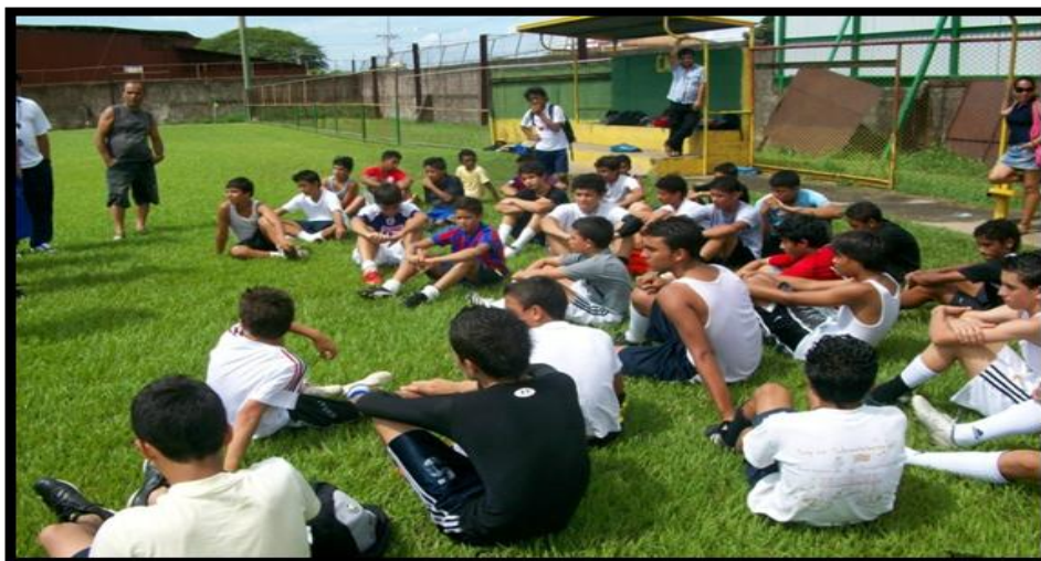
Presentación Grupo de Gimnasia.