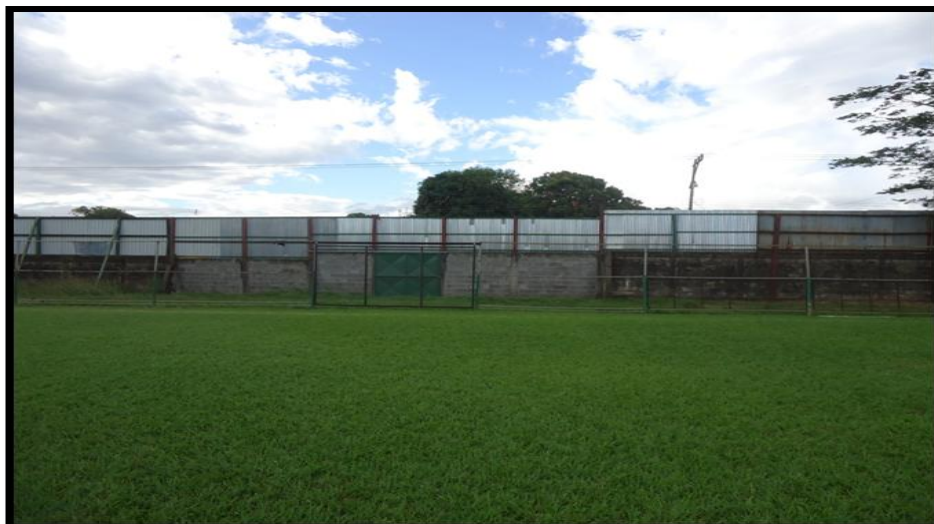
Mantenimiento de Gramilla