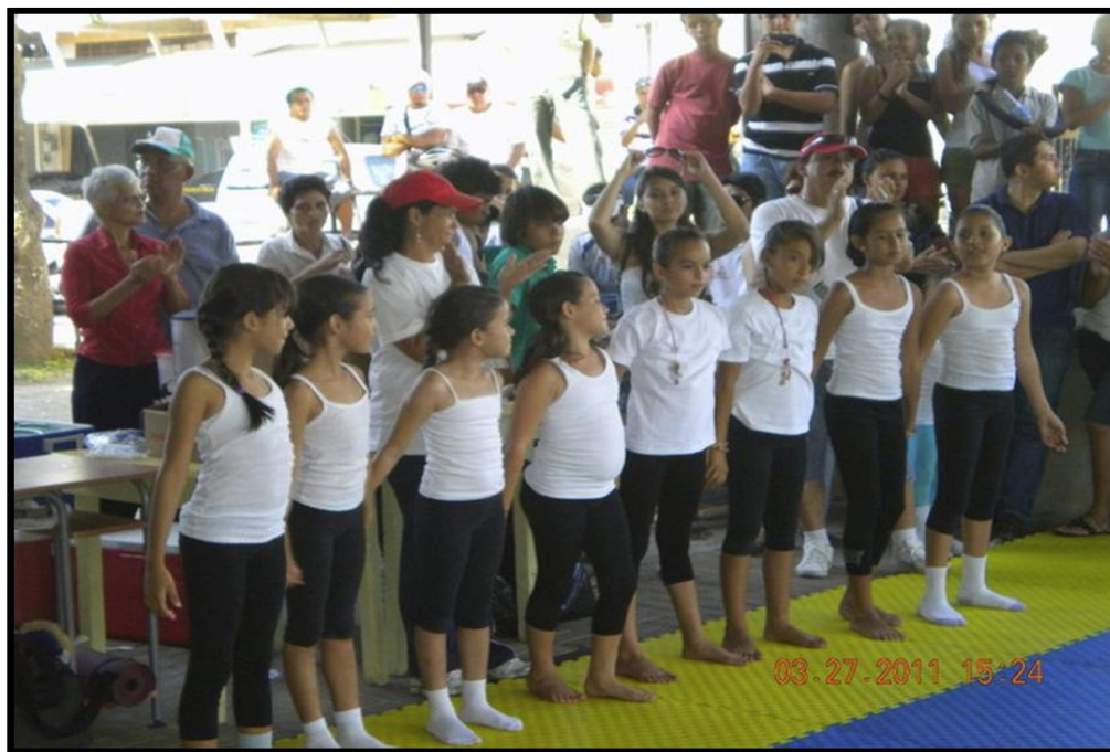
Grupo de Karate -do